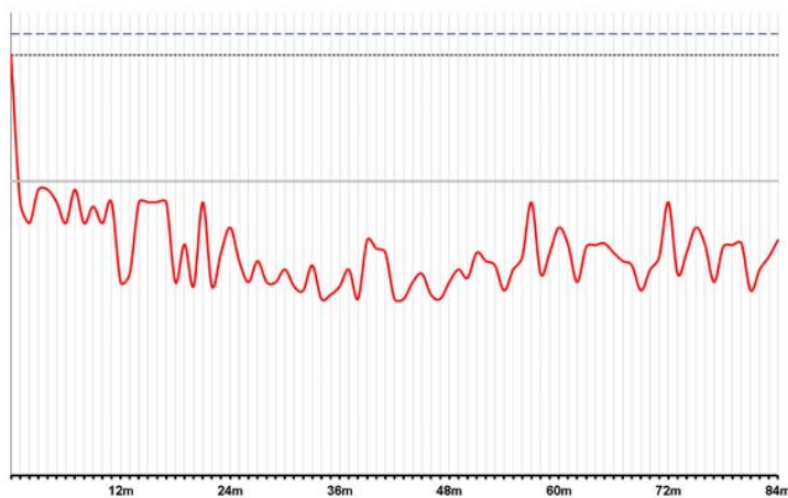
De la date d'émission (en mois) aux dates d'évaluation

Exemple un – Les billets ne sont pas automatiquement remboursés par anticipation étant donné que le niveau de clôture de l'indice à chaque date de constatation est inférieur au niveau de remboursement par anticipation automatique. Le niveau final de l'indice à la date d'évaluation finale est égal ou inférieur au niveau de la barrière.